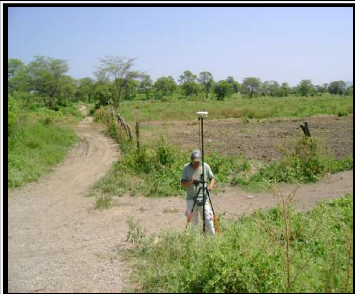
Levantamiento de Linderos mediante Sistema de Posicionamiento Global Diferencial (DGPS)