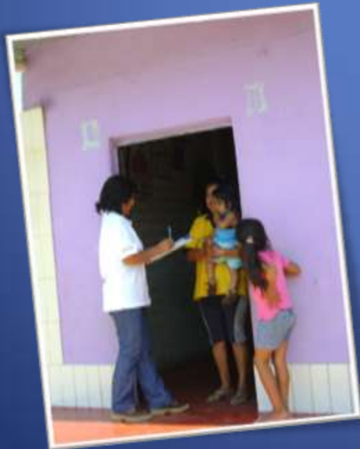
Ubicación de Predios

Se han realizado 59 Linderaciones de Predios y 96 Empadronamientos.