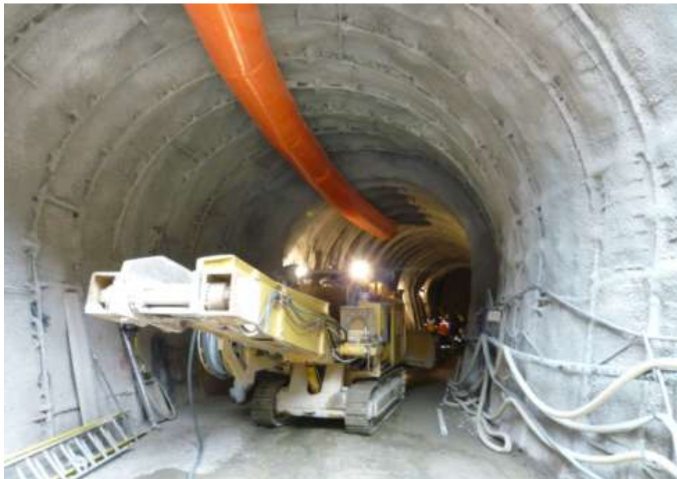
TRABAJOS EN GALERÍA