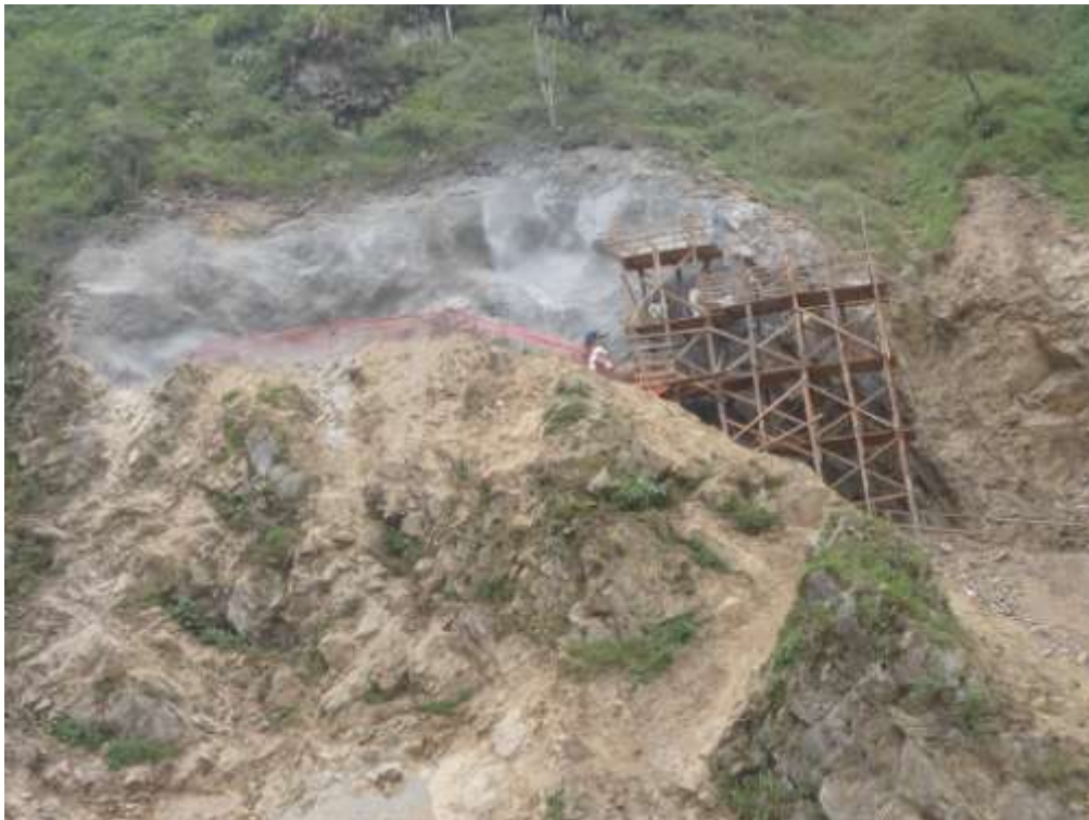
Portal de salida