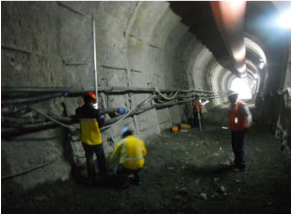
EQUIPO TOPOGRAFICO EMPLANTILLANDO LOS NIVELES PARA LA CIMENTACION DEL PISO DE LA GALERIA