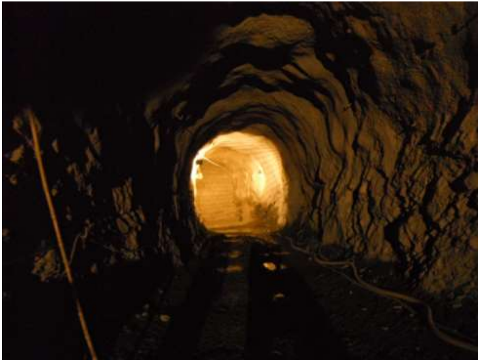
FINAL DE LA EXCAVACION SUBTERRANEA DE LA GALERÍA DE ACCESO