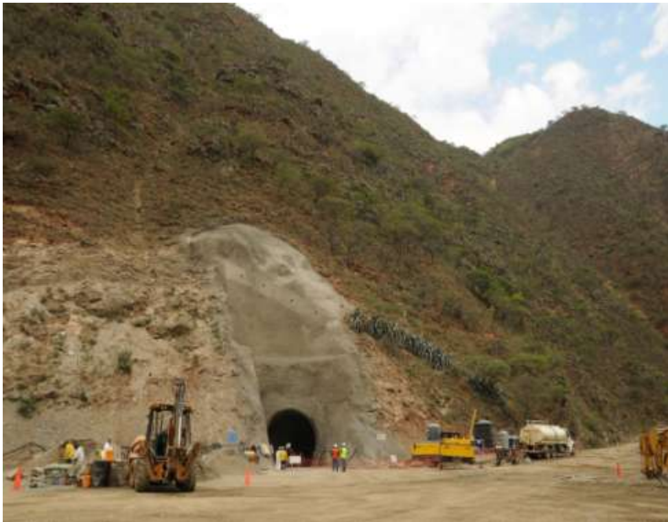
GALERÍA DE ENTRADA DEL TÚNEL TRASANDINO