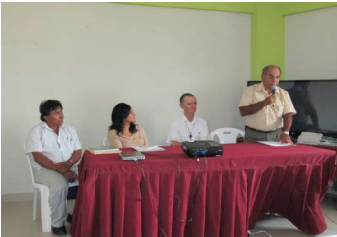
Proyecto Alto Piura presentó resultados de empadronamiento