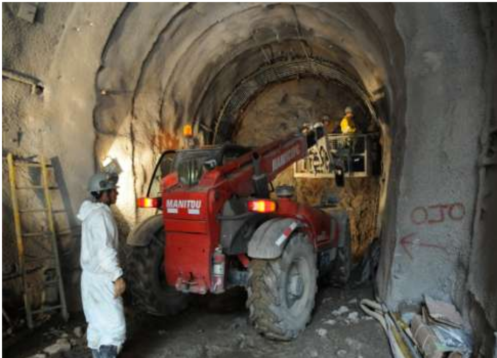
PERFORACIÓN DE LA GALERÍA DE ENTRADA DEL TÚNEL TRASANDINO