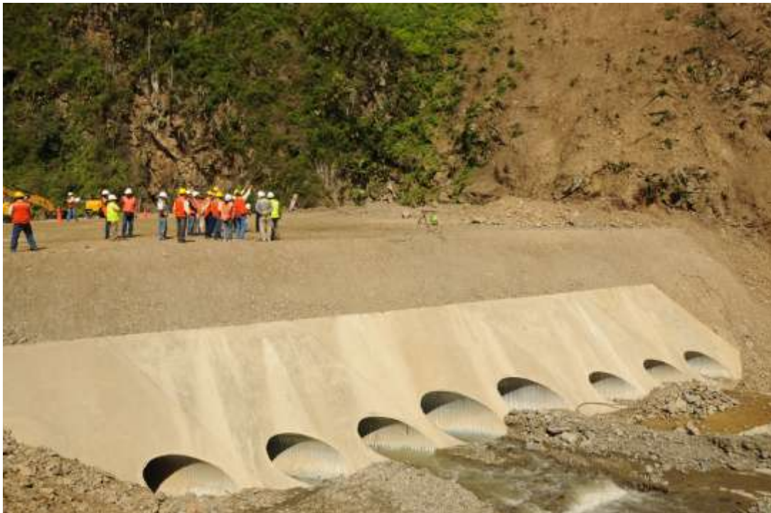
Preparación para el portal de salida